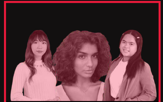
ฝ่ายการตลาด