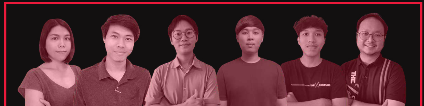
ฝ่ายการพัฒนาและออกแบบเว็บไซต์