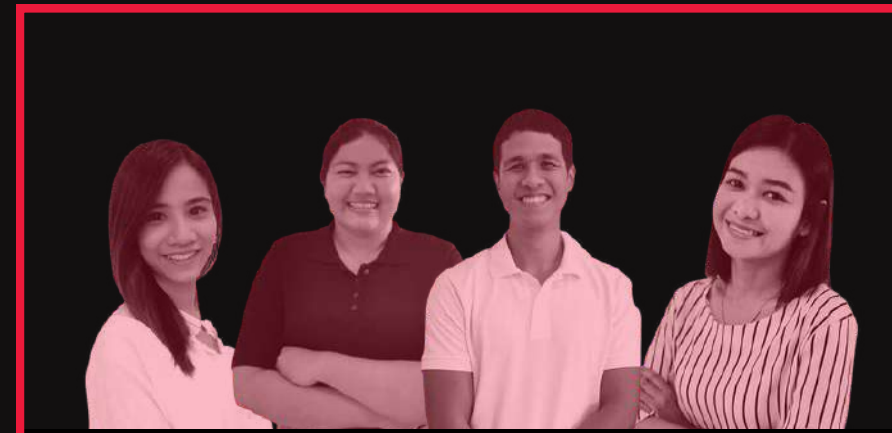
ฝ่ายการจัดการโรงแรม